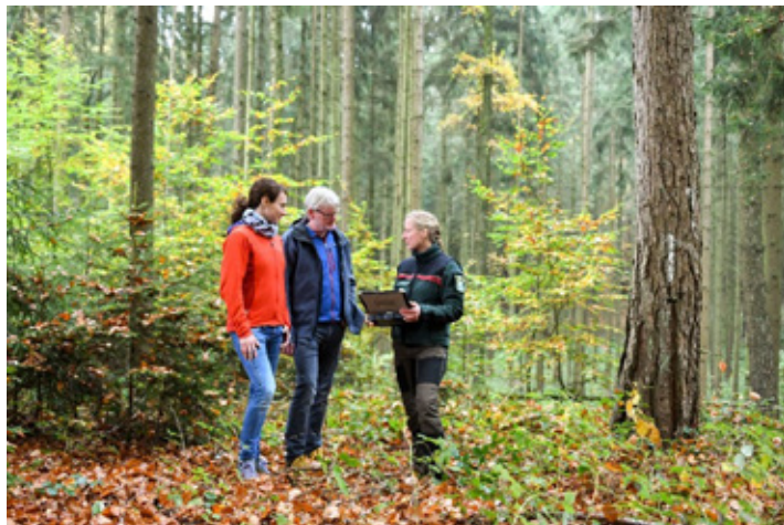
Försterin erklärt Waldbesitzenden die Inventuraufnahme zum Forstlichen Gutachten.

Die staatlichen Försterinnen und Förster wollen nun herausfinden, ob die Wildbestände in den Jagdrevieren angepasst sind oder ob es noch Handlungsbedarf gibt. Von Ende Februar bis Anfang Mai werden an Inventurpunkten die Waldverjüngung, sowie die Verbiss- und Fegeschäden systematisch erfasst. Hierzu sind alle Beteiligten (Personen mit Eigentumsrechten sowie die jeweiligen Jagdausübungsberechtigten) herzlich eingeladen. Die Teilnahme bei den Außenaufnahmen ist ausdrücklich erwünscht. Die Ergebnisse der Inventuren werden bis November zusammengefasst und bewertet. Für die Unteren Jagdbehörden sind die neutralen und objektiven Gutachten der Forstbehörde eine wichtige Entscheidungsgrundlage bei der behördlichen Abschussplanung, die alle drei Jahre ansteht. Jagdgenossen und Jäger lädt das AELF Bayreuth-Münchberg zu einer Informationsveranstaltung am 20.02.2024 ab 19:30 Uhr rund um das Thema „Forstliches Gutachten 2024“ ein.